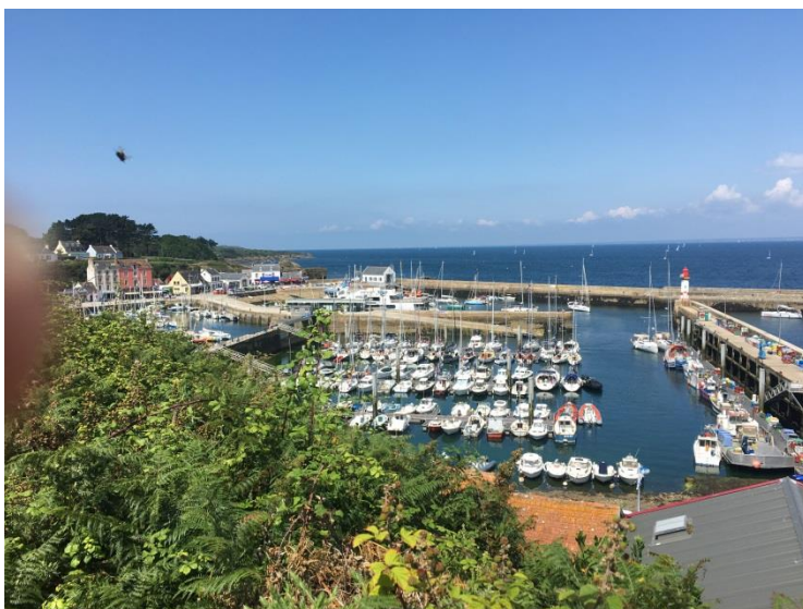
Port Tudy (Iles de Groix)

26 juillet : Guidel-Plage Port Tudy (Ile de Groix)