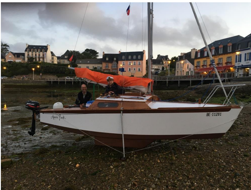
"Anna Pink" béquillé dans le port de Camaret.

La navigation en Bretagne n'est pas simple, mais si enrichissante. Il faut composer avec la météo, la marée et les courants. Ce jour-là, l'heure de départ favorable est 18 heure pour passer le goulet de Brest avec le courant. Donc il ne va pas falloir trainer pour arriver à Camaret avant la nuit, surtout qu'il faut tirer quelques bords !