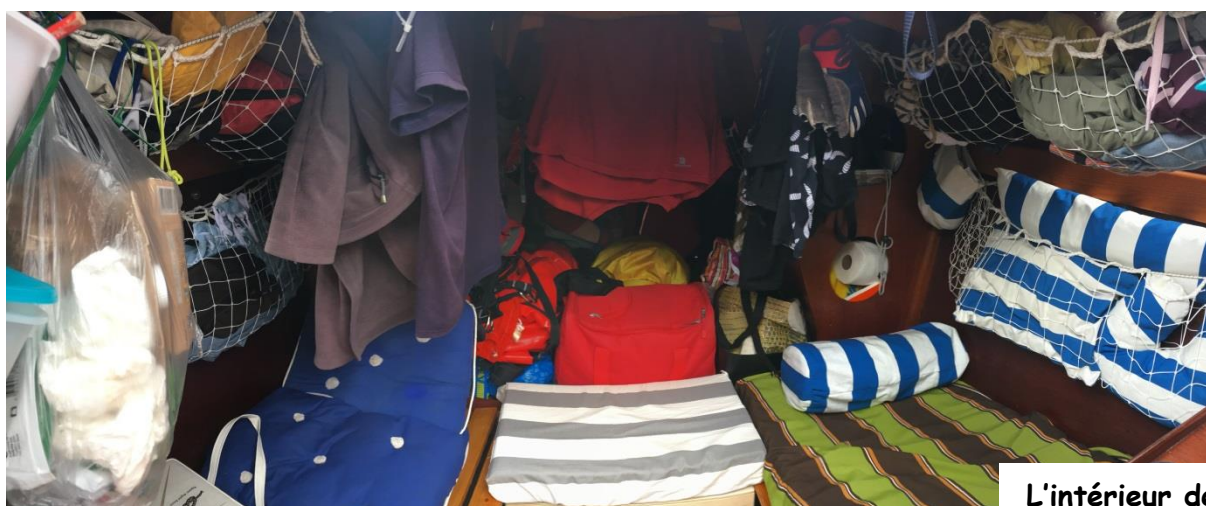
L'intérieur de notre palace durant 3 semaines !