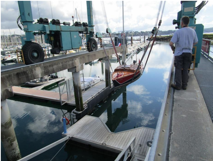
Mise à l'eau à Brest, port du Moulin Blanc.

La navigation en Bretagne n'est pas simple, mais si enrichissante. Il faut composer avec la météo, la marée et les courants. Ce jour-là, l'heure de départ favorable est 18 heure pour passer le goulet de Brest avec le courant. Donc il ne va pas falloir trainer pour arriver à Camaret avant la nuit, surtout qu'il faut tirer quelques bords !