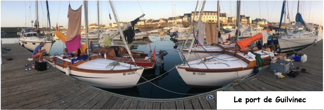
Le port de Guilvinec