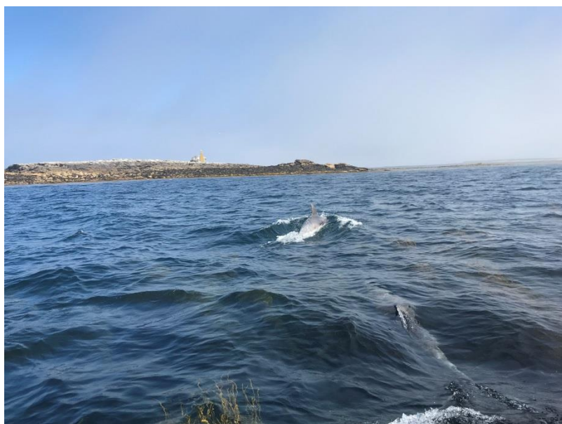
Les dauphins et l'île de Sein.

Etape la plus longue, 23 miles et il faudra tirer quelques bords ! Mais l'île de Sein c'est du sérieux ! Et il ne faut pas se faire piéger par les courants ! Il fait beau. 3-4bf. Mais plus on s'approche de l'île, plus il y a de la brume qui se fixe sur la mer ! Soudain, on n'y voit plus rien et il y a des rochers partout ! Je m'imagine sans GPS ! Pourtant même avec cet instrument si précieux, mon cerveau ne veut pas prendre la même orientation que l'appareil ! Panique à bord ! Mais soudain, comme dans un film, le soleil réapparaît, et comme par enchantement, des dauphins tournent autour du bateau comme pour nous guider dans le port !