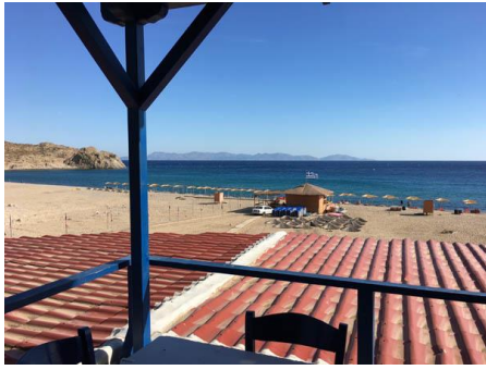
Journée de plage à Samothraki