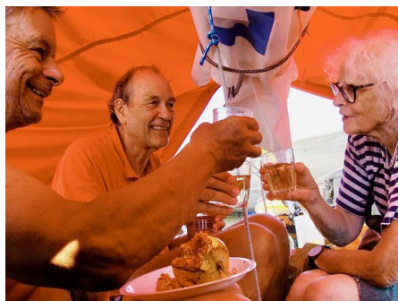
Comme à la maison