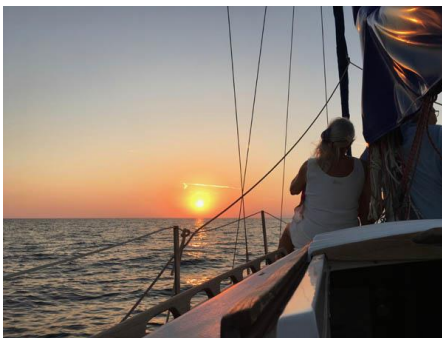
Dernière balade à Alexandroupolis

L'improbable et merveilleuse croisière est déjà terminée... C'est simplement inoubliable, nous n'aurions pas pu imaginer mieux !