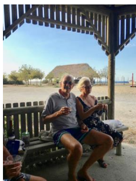
Plage privée à Therma