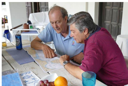
On étudie les cartes

Une baignade serait bienvenue, nous marchons le long de la plage sur un interminable tapis mou et épais d'algues séchées puis atteignons une plage avec des cabines rigolotes. On se baigne enfin et c'est bien agréable. Nager donne faim, nous décidons de partir au hasard à la recherche d'un restaurant. Espérant atteindre le village d'Îmeros, nous suivons une route bordée de champs de coton. Exténués nous arrivons au bout d'une heure dans le village et rentrons dans l'unique bistrot. Choix limité, il y a du Suflaki, c'est à dire brochettes de viande et frites. Mais quelles excellentes pommes frites, on y retournerait tous les jours !