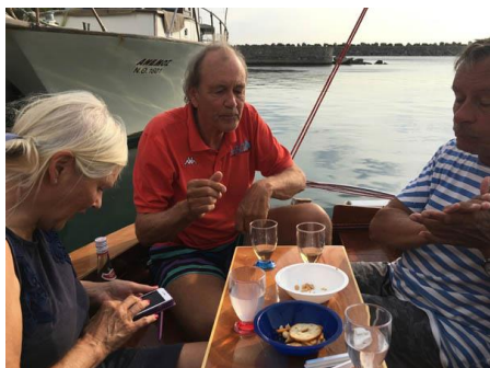
Tout va bien avec l'ouzo