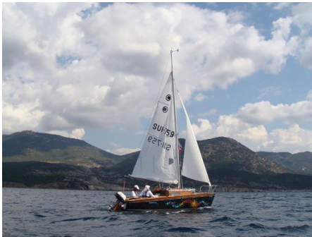
De retour vers Alexandroupolis