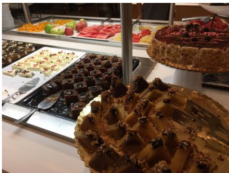
Dessert à discrétion