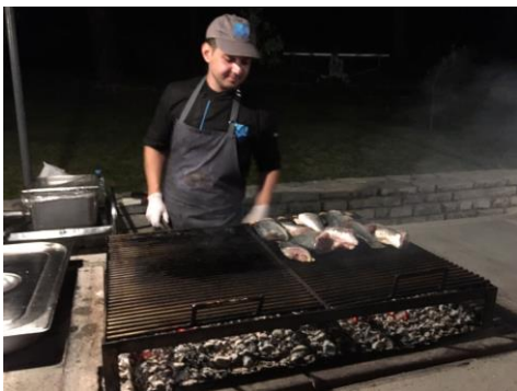
Fisch à discrétion